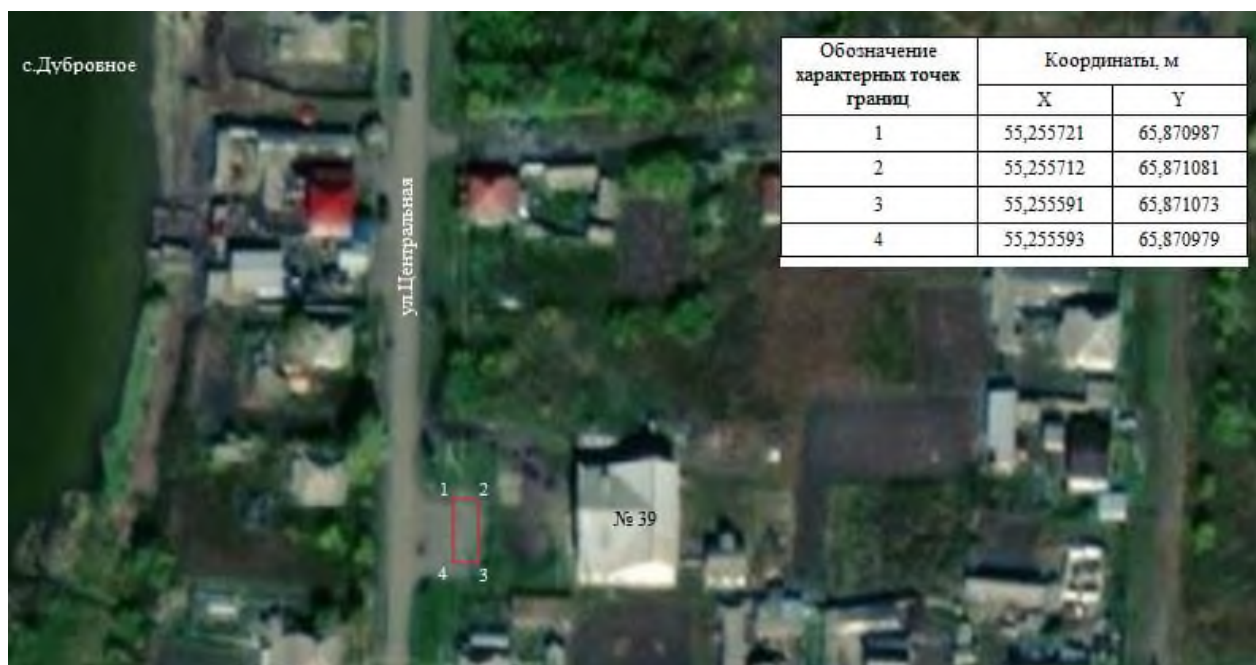
Схема размещения универсальной ярмарки на территории Южного сельсовета Варгашинского района Курганской области

Приложение 1 к постановлению Администрации Южного сельсовета Варгашинского района Курганской области от 30 июля 2021 года № 58 «Об организации универсальной ярмарки на территории Южного сельсовета Варгашинского района Курганской области»